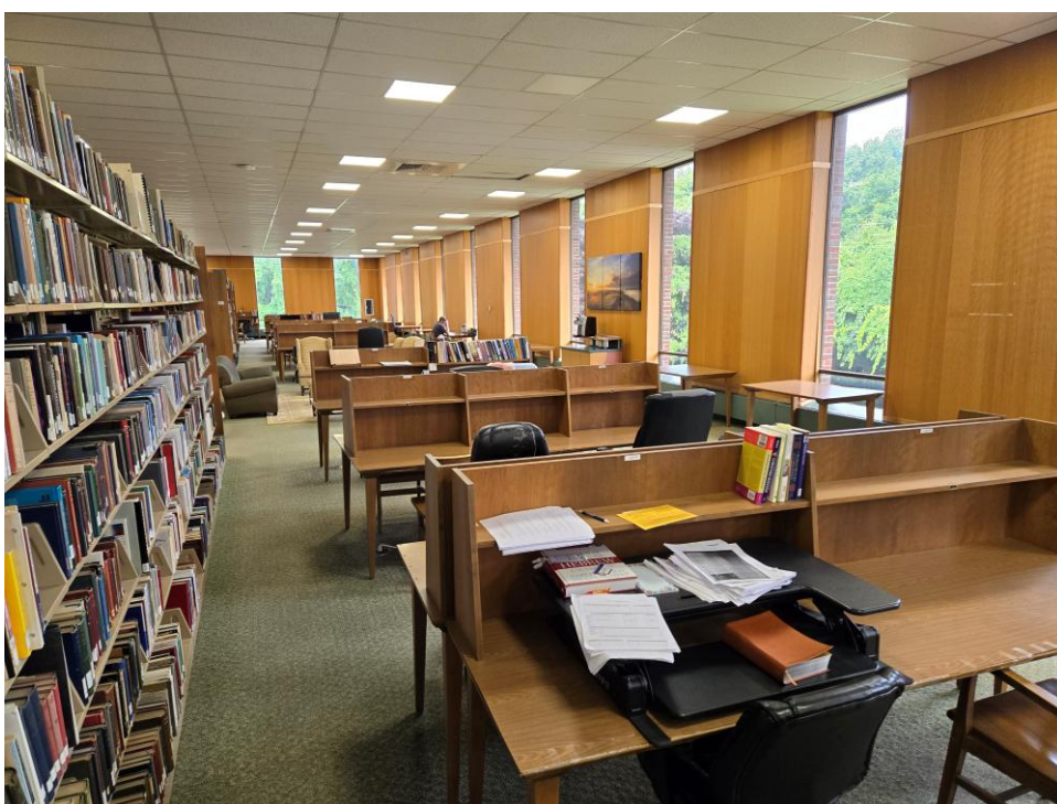
(六) 图书馆和学习空间