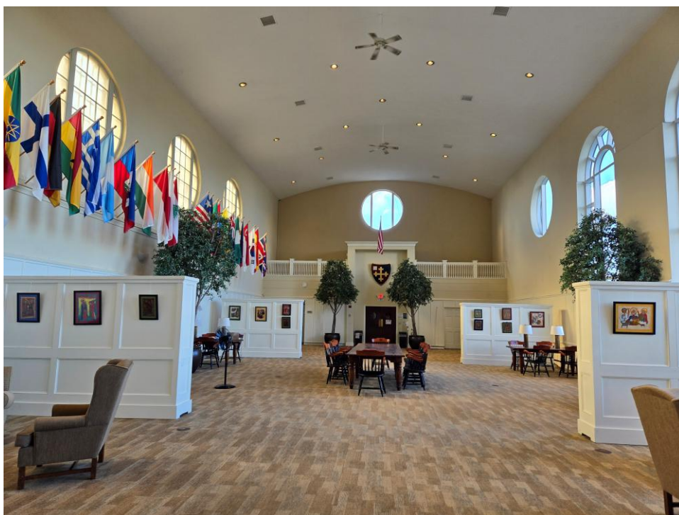
(七) 学院的大厅，也是一个公共学习区。