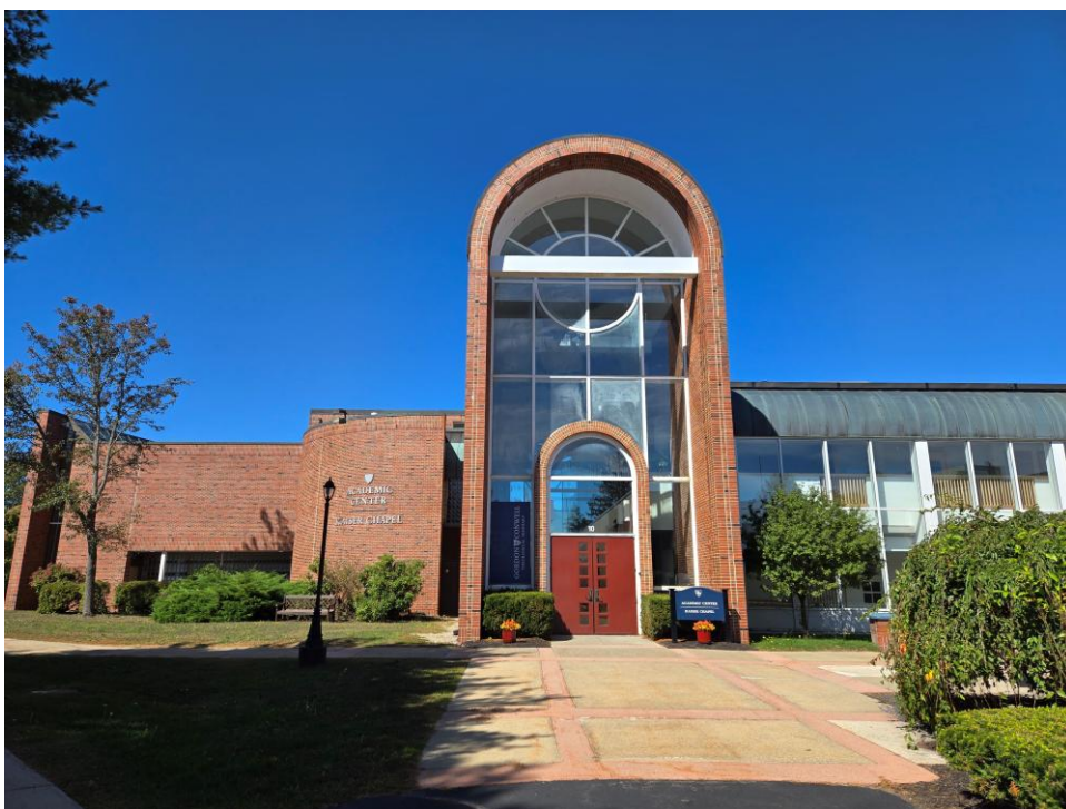
(五) 学术中心和崇拜厅