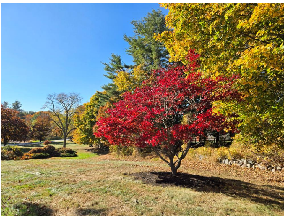
(三) 秋天的校园，景色格外美丽。