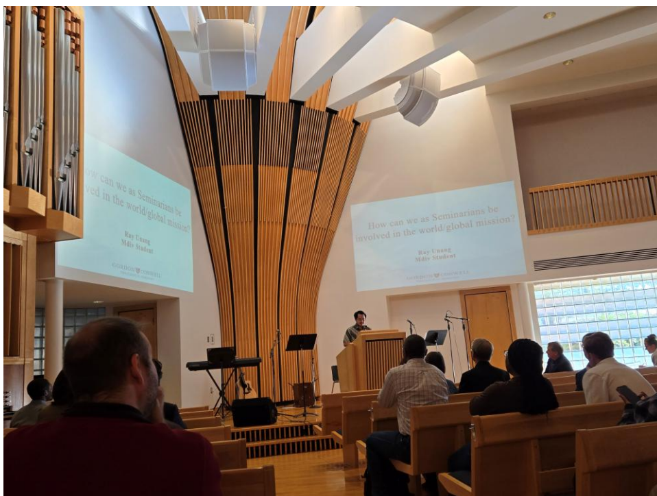
(十三) 学院早会中的宣教分享。