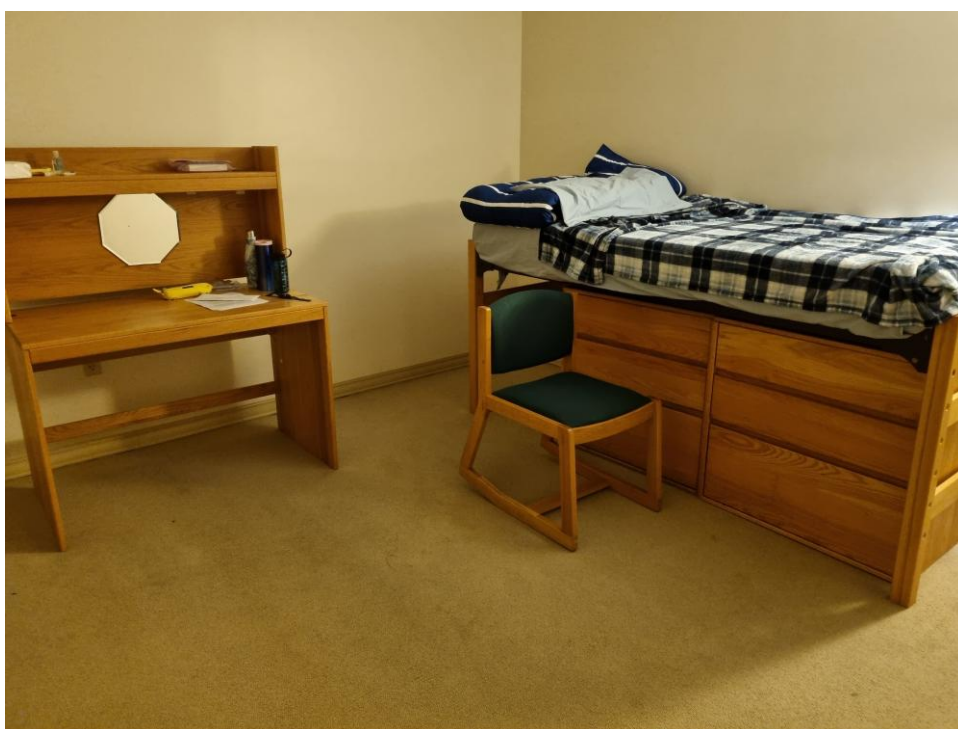
(八) 我的卧室—是我休息和自习的地方。