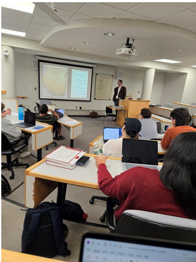
(十一) 上旧约导论课。