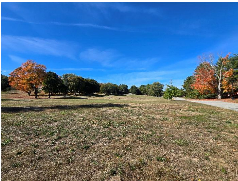
(二) 校园里的一大片空地。