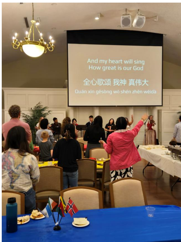
(十二) 在一个“万国共进晚餐”的聚会，共享各地的美味菜肴。