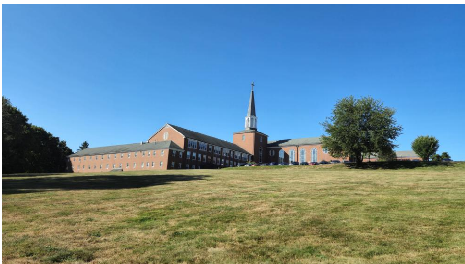
(一) 主楼 Kerr Building, 内有宿舍、食堂、行政室。