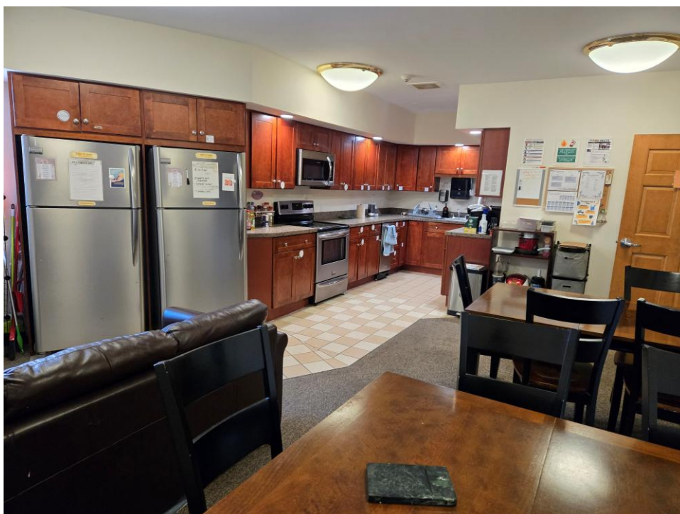
(九) 女生宿舍共用的厨房。